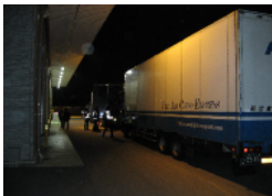
お疲れ様です！安全運行指導です。 続々と到着！