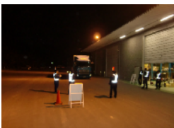
オーライ！オーライ！