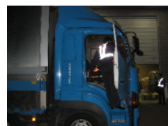
車内も点検しました！ 車内の整理整頓ヨシ！