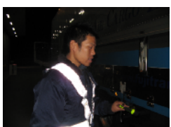
マーカー球もOKです！