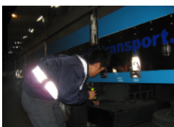
本社整備課からも来ていただきました。 タイヤチェック ヨシ！