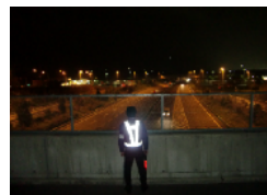
亀山を通過する車両は全車実施！ 見逃しません！