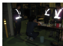
アルコールチェック 健康状態良好・飲酒なし！