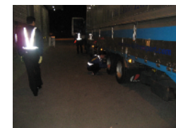
下回りも問題なし！