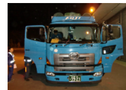
平車も到着しました！