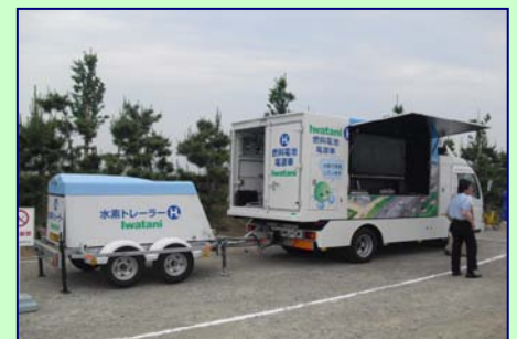
“騒音も排気ガスも出さない” クリーンな電力を供給