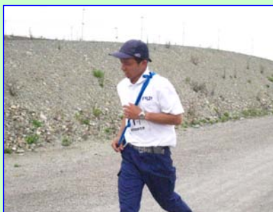
アンカーの北野君は4.5kmを走破! 最後まで頑張りました! お疲れ様です!