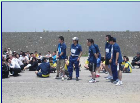
開会式で紹介されるメンバー7名