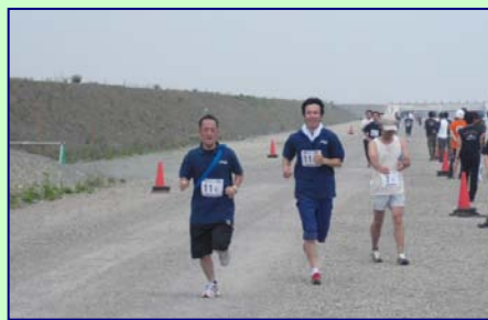
普段は安全運転! でも今日は全力疾走!!