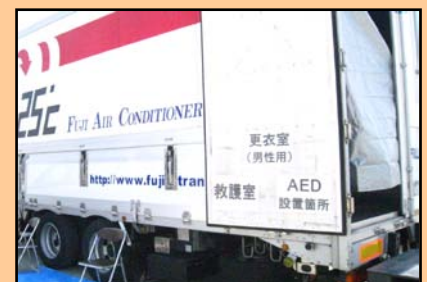
この日の最高気温は30度! ランナーの皆さんは、体を冷やす為 18度に冷えた空調車の庫内で一休み

第二滑走路で貴重な体験が出来ました! 次回も、是非参加させて頂きたいと思っております!