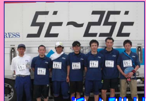
精鋭(?)された7名 チームFUJI