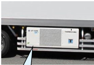
サーモキング社製 UT-1200SR (サブエンジン式)